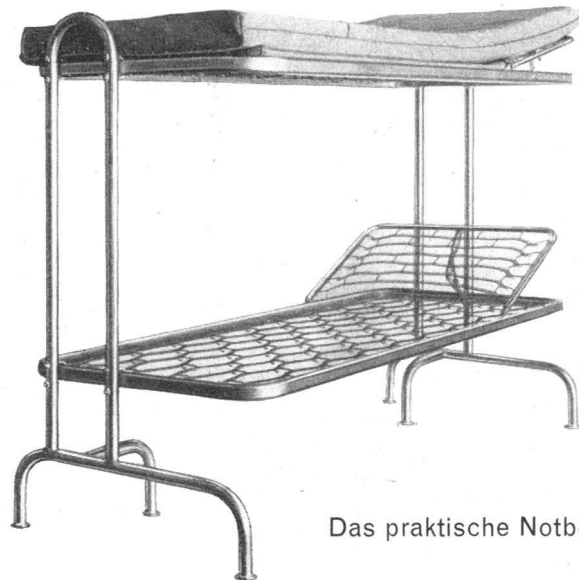
Das praktische Notbett