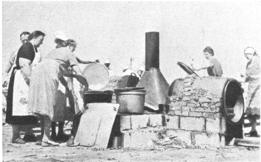
Auch die Notverpflegung, wie sie hier amerikanische Frauen üben, gehört zur Obdachlosenhilfe (vgl. den Artikel auf Seite 64).

Innenminister Richard A. Butler erklärte in einer Radioansprache, die Zivilverteidigung könnte ausserordentlich viel dazu beitragen, um die Auswirkungen eines H-Bombenangriffs zu vermindern. Der grösste Teil des Landes würde Schäden entgehen, und der radioaktive Rückstand sei ein «Mörder, gegen den wir uns wehren können». Butler, dessen Ministerium für die Zivilverteidigung in Kriegszeiten zuständig wäre, verlangte dann Rekruten für die Zivilverteidigung und fügte hinzu: Die Radioaktivität nimmt rasch ab, und die Dosis, die einen trifft, ist weit geringer, wenn man irgendeine Art dicker Abschirmung zwischen sich und die Quelle der Strahlung legt. Sogar ein gewöhnliches Haus könnte eine gefährliche in eine unschädliche Dosis verwandeln. In vielen unversehrten Gebieten könnte die Bevölkerung schlimmen Auswirkungen entgehen, wenn sie unter Abschirmung bleibt, bis die Radioaktivität abgenommen hat.