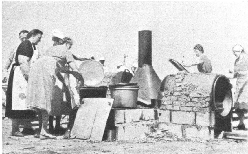
Auch die Notverpflegung, wie sie hier amerikanische Frauen üben, gehört zur Obdachlosenhilfe (vgl. den Artikel auf Seite 64).

Innenminister Richard A. Butler erklärte in einer Radioansprache, die Zivilverteidigung könnte ausserordentlich viel dazu beitragen, um die Auswirkungen eines H-Bombenangriffs zu vermindern. Der grösste Teil des Landes würde Schäden entgehen, und der radioaktive Rückstand sei ein «Mörder, gegen den wir uns wehren können». Butler, dessen Ministerium für die Zivilverteidigung in Kriegszeiten zuständig wäre, verlangte dann Rekruten für die Zivilverteidigung und fügte hinzu: Die Radioaktivität nimmt rasch ab, und die Dosis, die einen trifft, ist weit geringer, wenn man irgendeine Art dicker Abschirmung zwischen sich und die Quelle der Strahlung legt. Sogar ein gewöhnliches Haus könnte eine gefährliche in eine unschädliche Dosis verwandeln. In vielen unversehrten Gebieten könnte die Bevölkerung schlimmen Auswirkungen entgehen, wenn sie unter Abschirmung bleibt, bis die Radioaktivität abgenommen hat.