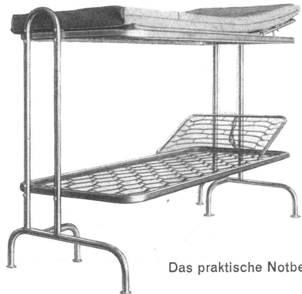
Das praktische Notbett