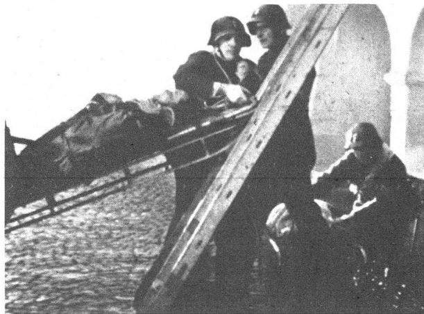
Menschenrettung mit Schlitten

Eine Kriegsfeuerwehr lässt sich nicht von heute auf morgen organisieren, ausrüsten und ausbilden. Es braucht hierzu zeitraubende Vorbereitungen . Deshalb