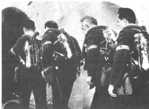
Schwerer Gasschutztrupp macht sich bereit

Grundsätzlich wird notwendig sein, dass überall da, wo Friedensfeuerwehren bestehen, auch Kriegsfeuerwehren aufgestellt werden.