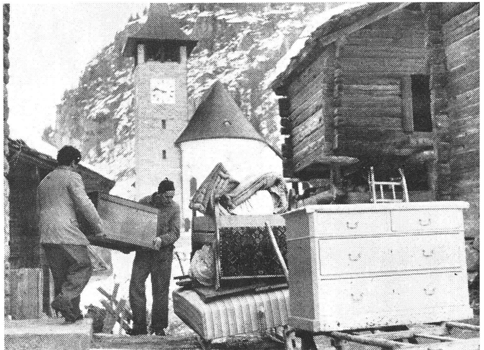
Der am 24. Mai 1959 zum Entscheid stehende neue Verfassungsartikel für den Zivilschutz bestimmt in einem besonderen Absatz: «Das Gesetz ordnet den Einsatz von Organisationen des Zivilschutzes zur Nothilfe.» Die Annahme des Verfassungsartikels bedeutet also auch eine rechtliche Fundierung der Zivilschutzhilfe im Frieden.