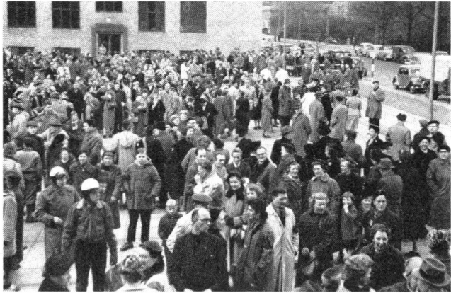
Die Zivilschutzvorbereitungen in Dänemark werden sehr ernsthaft betrieben, wie diese Aufnahme von einer Evakuierungsübung zeigt. Hier warten die Menschen, um von einer Autokolonne aufgenommen zu werden.

Die örtliche Zivilverteidigung besteht aus den örtlichen staatlichen und kommunalen Behörden, d. h. dem zuständigen Polizeidirektor und den kommunalen Zivilverteidigungskommissionen , deren Vorsitzender der betreffende Bürgermeister (Gemeindevorsteher) ist. Zum Arbeitsbereich der kommunalen Zivilverteidigungskommission gehören Aufgaben kommunaler Art, in erster Linie die Organisation des örtlichen Hilfsdienstes, der auf Grund der in der Friedenszeit vorhandenen kommunalen Organe eingerichtet wird. Die Polizeidirektoren sind für eine