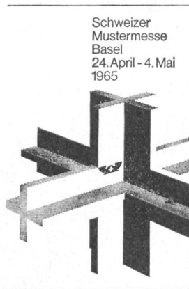
Schweizer Mustermesse Basel 24. April - 4. Mai 1965

legt werden. Humus-, Sand-, Kies-, Lehm- und Mergelschichten werden glatt durchstossen. Das Prinzip wird — in der Schweiz seit 1938 — auch in den schweren Moränenböden mit besonderem Erfolg angewendet.