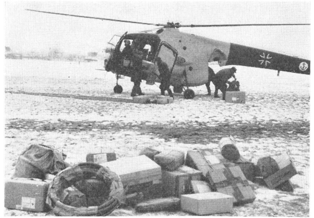
15 Marineflieger der Bundeswehr bringen Post auf eine vom Eis eingeschlossene Insel.

Sparten des Katastrophen- und des Zivilschutzes viel mehr als bisher Aufklärung darüber erhalten, wann und wie man Luftfahrzeuge einsetzen kann und was diese zu leisten vermögen. Nur durch enge Zusammenarbeit zwischen den herkömmlichen Rettungsdiensten auf der Erde und der fliegenden Hilfe kann ein bestmögliches Ergebnis für alle Beteiligten, nicht zuletzt für die hilfsbedürftigen Opfer von Katastrophen, erzielt werden.