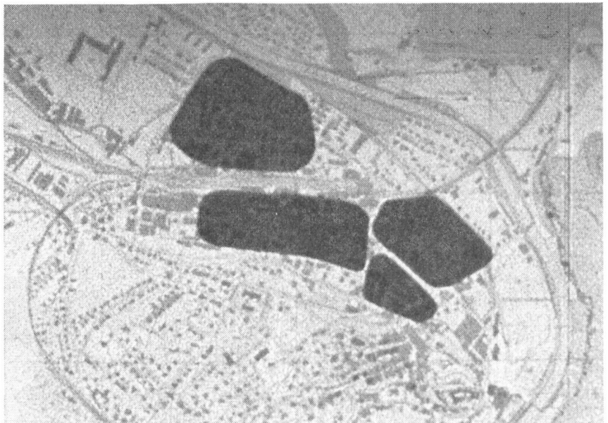
Mit diesem Kartenausschnitt, im erwähnten Instruktionsfilm beweglich mit Trick vor-geführt, werden in der Stadt Burgdorf die Ueberschwemmungsgefahren gezeigt.