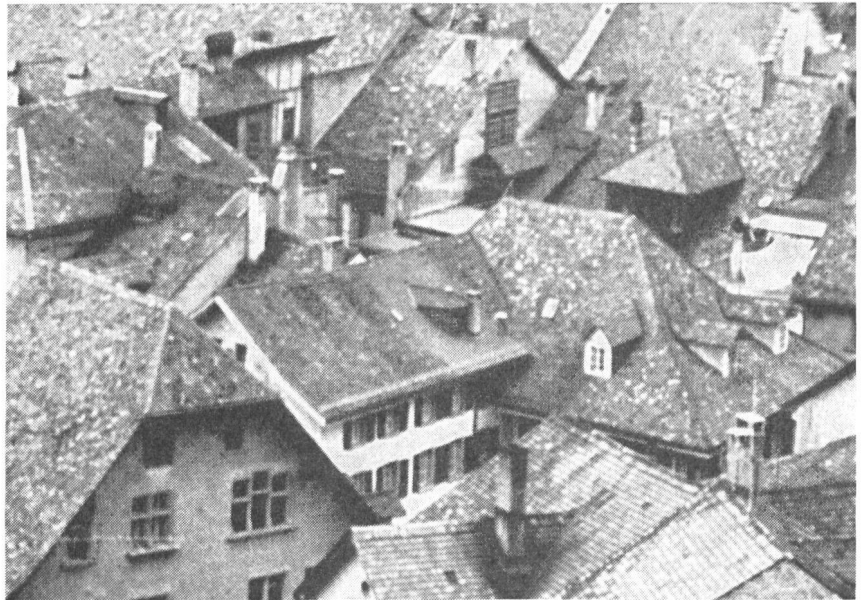
Die verschachtelten Giebel und Dächer der Altstadt mit viel Holzbauten bilden eine besondere Brandgefahr.