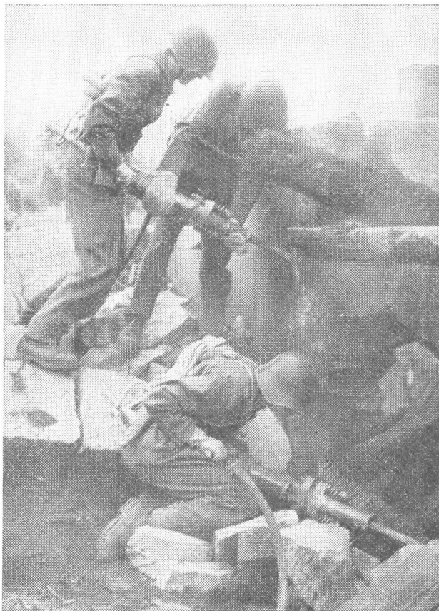
Luftschutztruppen im Einsatz.