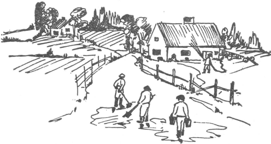
Rakennusten katot puhdistetaan saasteesta vesisuihkulla. Kulkutiet lakasemalla kosteana, runsaalla vesisuihkulla tai kuorimalla pintakerros.

ovat suojapuku, -naamari, -jalkineet ja -käsineet välttämättömät.