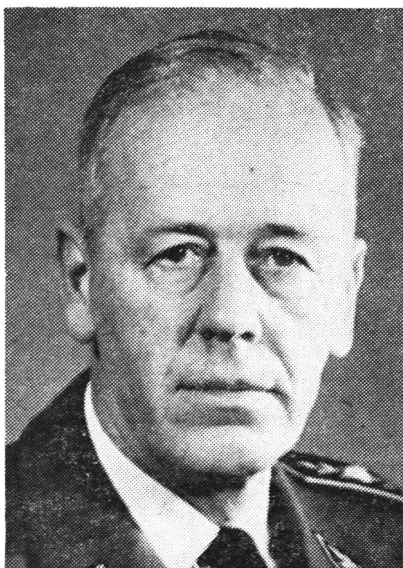
Oberstbrigadier Charles Folletête †

Ei drova denton aunc gronds sforzs e dabia orientaziun per che nies Cantun seigi en cass da basegns preparaus e stgis avunda da proteger nossa populaziun civila sufficientamein.