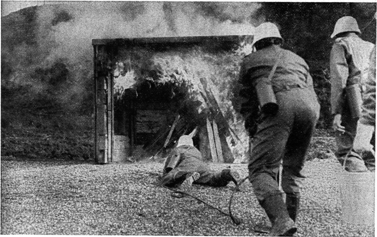
Einsatzdemonstration eines Hauswehredetachements in der offenen Brandanlage