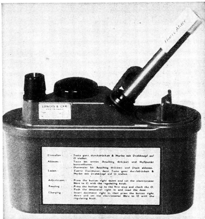
Dosimeter mit Lade- und Ablesegerät