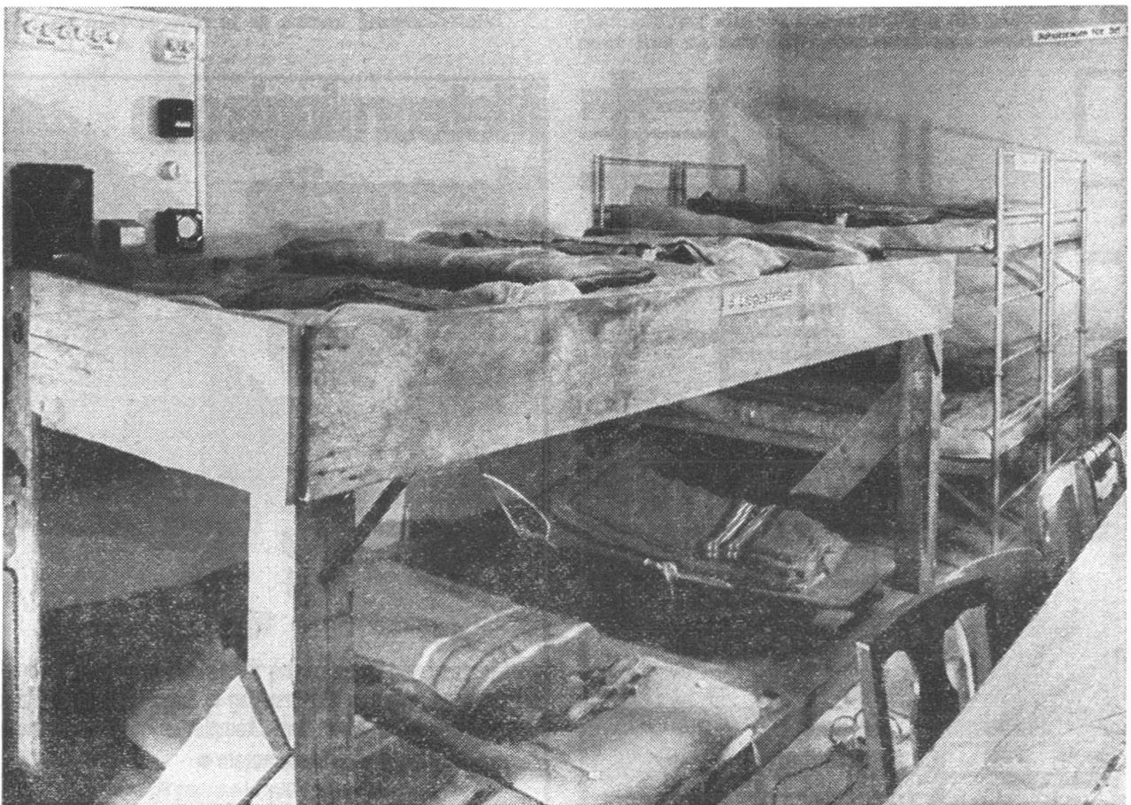
Eine Uebersicht der übereinander angebrachten Liegestellen, die je nach Möglichkeiten verschieden ausgerüstet werden können