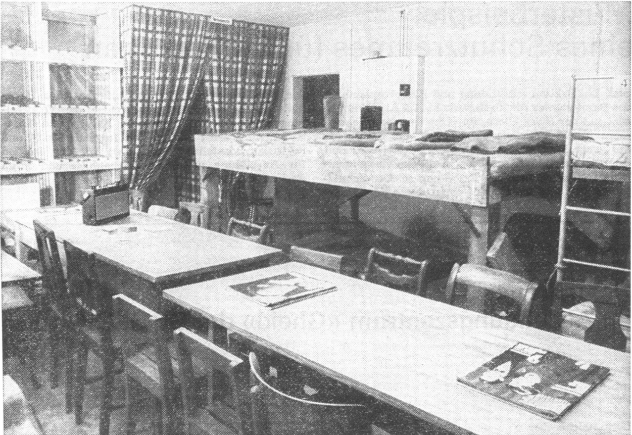
Blick in den Musterschutzraum mit dem Mitteltrakt, den Tischen und Stühlen, einem Teil der Liegestellen, dem Gestell für das Notgepäck. Hinter dem Vorhang die Notaborte. Auch das Transistorengerät für die Verbindung mit der Aussenwelt fehlt nicht