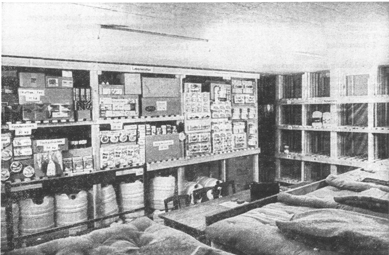
Das Gestell mit dem Lebensmittel- und Wasservorrat, wie er in den Schutzraum dieses Ausmasses gehört. Die Vorräte können hier als Notvorrat der Hausgemeinschaft gelagert oder nach Plan bei Bezug des Schutzraumes von den Mitgliedern der Hausgemeinschaft mitgebracht werden. Verantwortlich ist der Schutzraumwart