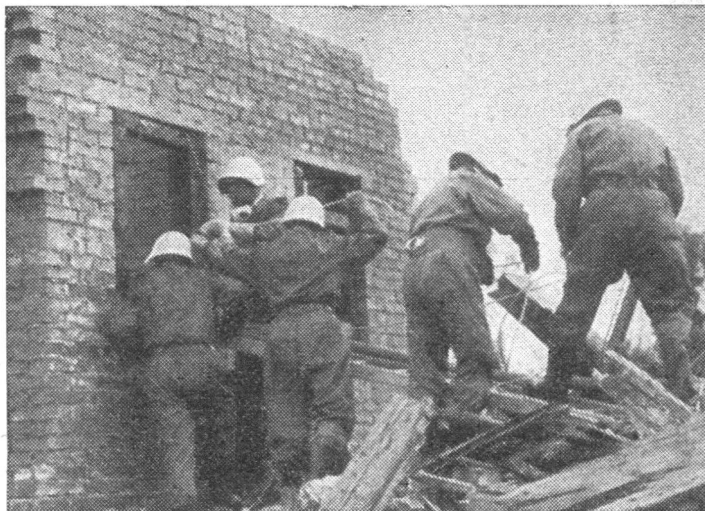
Retten und bergen im Trümmerfeld.

Luzern hat in der Tat dem ganzen Lande ein Beispiel gegeben, das noch lange anhalten möge und alle Kantone und Sektionen des SBZ dazu bringt, in ihrem Bereich mit gleicher Zielstrebigkeit und Initiative Zivilschutzaufklärung zu treiben, die heute die notwendige Grundlage jeder Aufbauarbeit bildet.