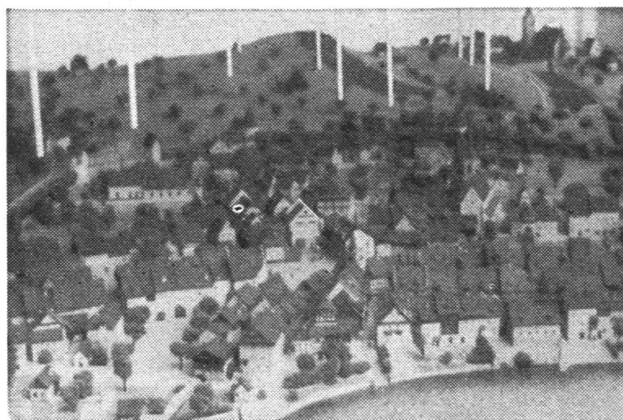
Am Beispiel der Stadt Zug aus alter Zeit, umgeben von Schutz- und Trutzmauern wird gezeigt, dass der Mensch seit seiner Erschaffung immer nach Schutz und Sicherheit strebte.