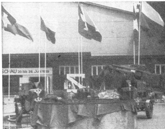
Der Eingang zur Ausstellung mit einem Wasserspeicher, Fahrzeugen und Material der Luftschutztruppen.

Die von Architekt Walter Schweizer und Graphiker Georg Sperl gestaltete Schau bot, angefangen bei den gesetzlichen Grundlagen, bis zur Darstellung der verschiedenen Dienstzweige und ihres Materials, eine umfassende Einführung in die Notwendigkeit, die Aufgabe und die Organisation des Zivilschutzes. Hervorheben möchten wir die gute und saubere graphische Gestaltung, welche die Ausstellung, die mit einem Gesamtbudget von 250 000 Franken rechnete, durch alle Stände und Darstellungen hindurch auszeichnete. Die Ausstellung hat einmal mehr gezeigt, dass eine gute Aufklärung auch etwas kostet und billige Improvisationen, wie sie aus Gründen der Sparsamkeit leider sehr oft praktiziert werden müssen, nicht immer den angestrebten Erfolg haben. Es war gerade diese saubere, im Aufbau durchdachte Darstellung, in der sich nach dem Baukastensystem