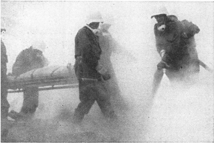
Durch Feuer und Rauch naht die Hilfe.