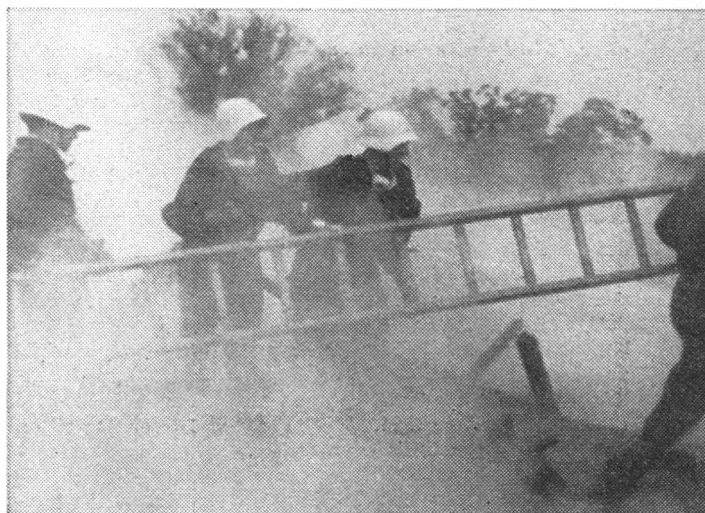
Ein Schnappschuss vom letzten Einsatz am Armeelag, der unter dem Blitzen und Donnern eines heftigen Gewittergusses sich abwickelte.