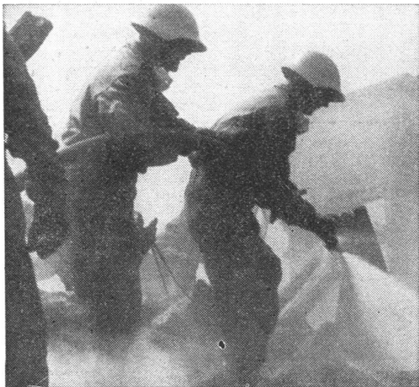
Vorgehen durch Feuer und Gift.