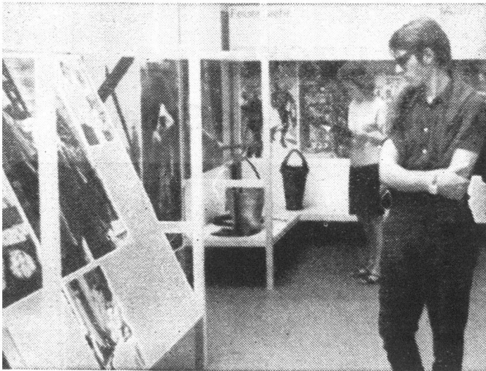
Ein Beispiel der sauberen Arbeit der Gestalter der ZZS, gezeigt mit einem Blick in den Pavillon des Standes Zug.