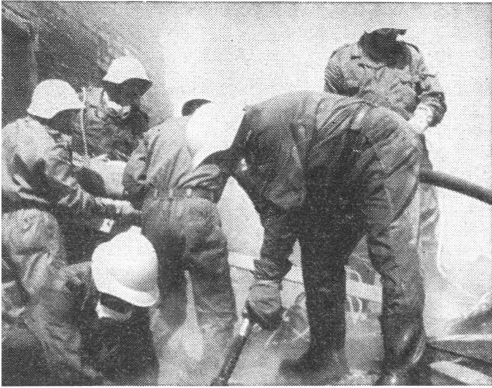
Bergung eines Verletzten durch ein Fenster mit dem Rettungsbrett.