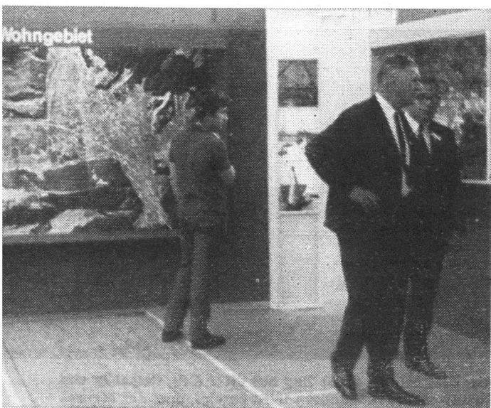
Blick in den Pavillon des Kantons Nidwalden.