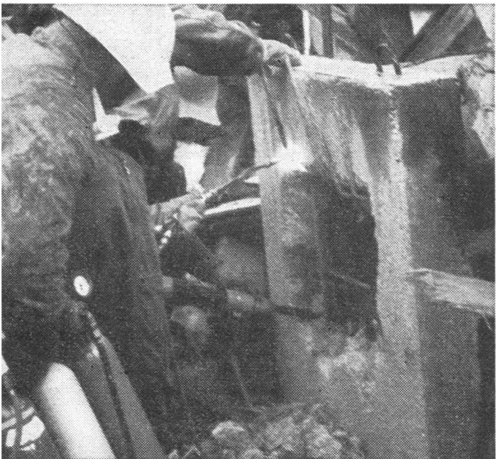
Mit dem Schweissbrenner wird der Durchgang in den Keller geöffnet.

genauso wichtige Säule unserer Abwehrbereitschaft wie sie die militärische Landesverteidigung darstellt. Die Betonung der Wichtigkeit des Zivilschutzes im Rahmen der Gesamtverteidigung bedeutet, dass der Zivilschutz die volle Unterstützung von uns als Bürger und Angehörige der Armee verdient. Dem Zivilschutz sind auch in Zukunft vermehrte Mittel zur Verfügung zu stellen.