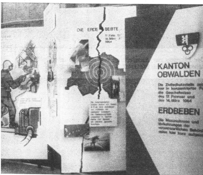
Ausschnitt aus der Darstellung des Katastrophenschutzes (Erdbeben) des Kantons Obwalden.