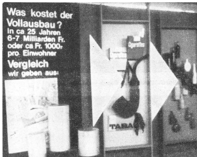
Eine gute Darstellung der Zivilschutzkosten. Unten: Trümmergelände auf der Allmend, bereit für die Einsatzübung, deren guter Chef Otto Gernet war.