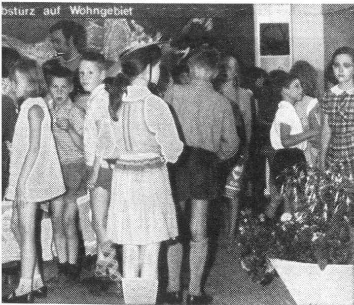
Das tägliche Bild der erfreulich vielen Schulklassen. Unten: Schaubild des Bundesamtes für Zivilschutz.