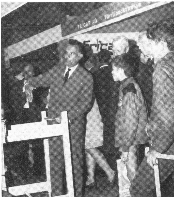
Dieses Gedränge, das immer wieder ein erfreulich grosses Interesse bekundete, gehörte zur sehenswerten Luzerner Schau.