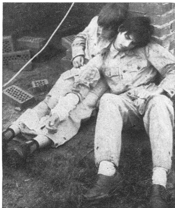
Unten: Gut mitgespielt haben auch die Figuranten, die zu rettenden «Verletzten».

Den Frauen und Männern in Dankbarkeit gewidmet, die als Mitarbeiter am Erfolg der Zentralschweizerischen Zivilschutzschau Anteil haben und unsere Anerkennung verdienen.