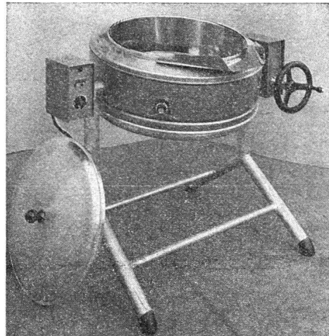
Bratpfanne Typ «Cantine»