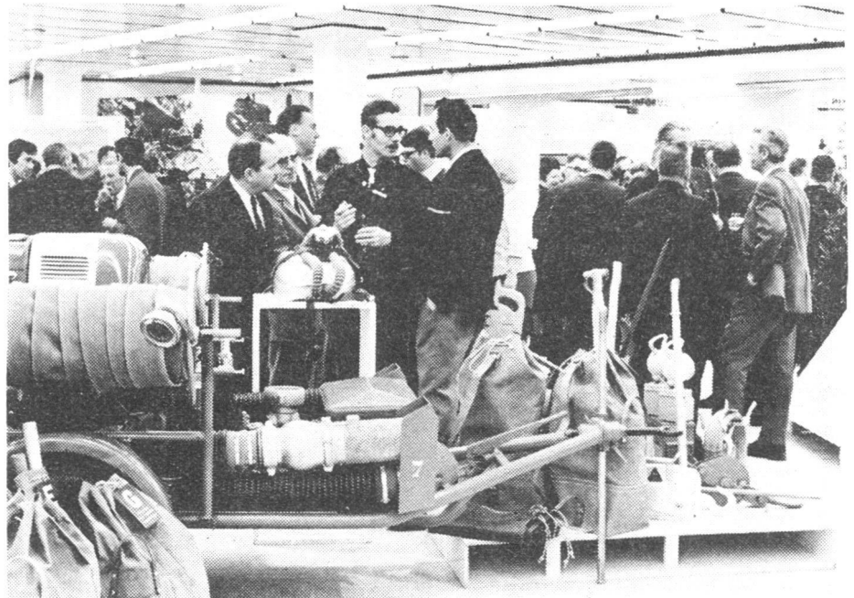
Interessierte Besucher am Eröffnungstag, die vor allem das moderne und reichhaltige Material bestaunten, das aus den Beständen des Lausanner Zivilschutzes zur Verfügung gestellt wurde