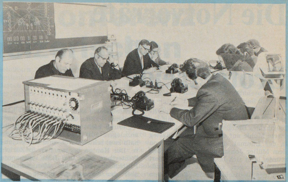
Schnappschuss von einem Kurs im Nachrichten- und Uebermittlungsdienst