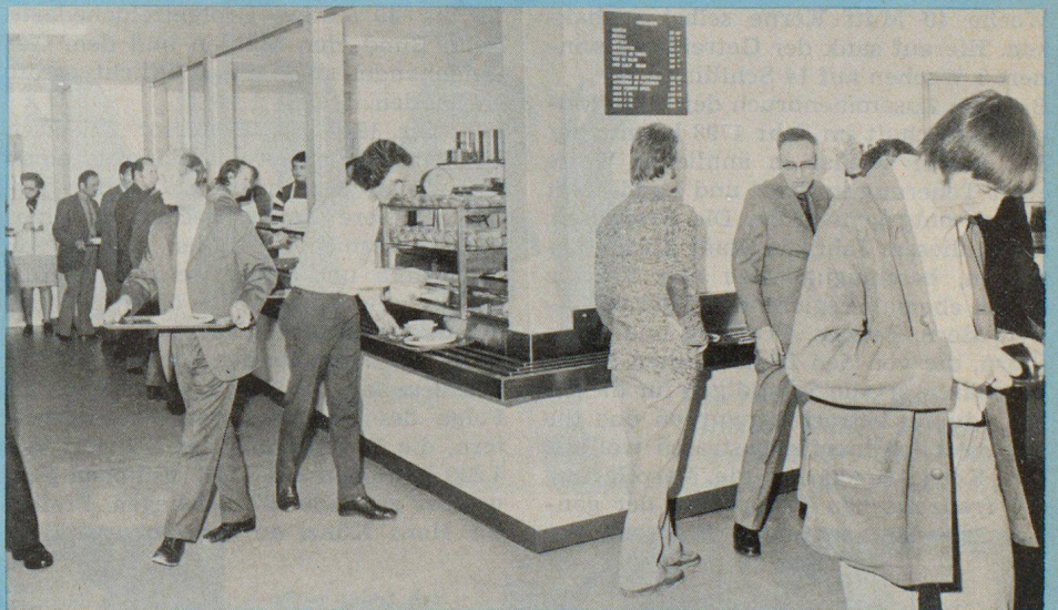
Blick in die praktisch ausgestaltete Kantine mit Selbstbedienung