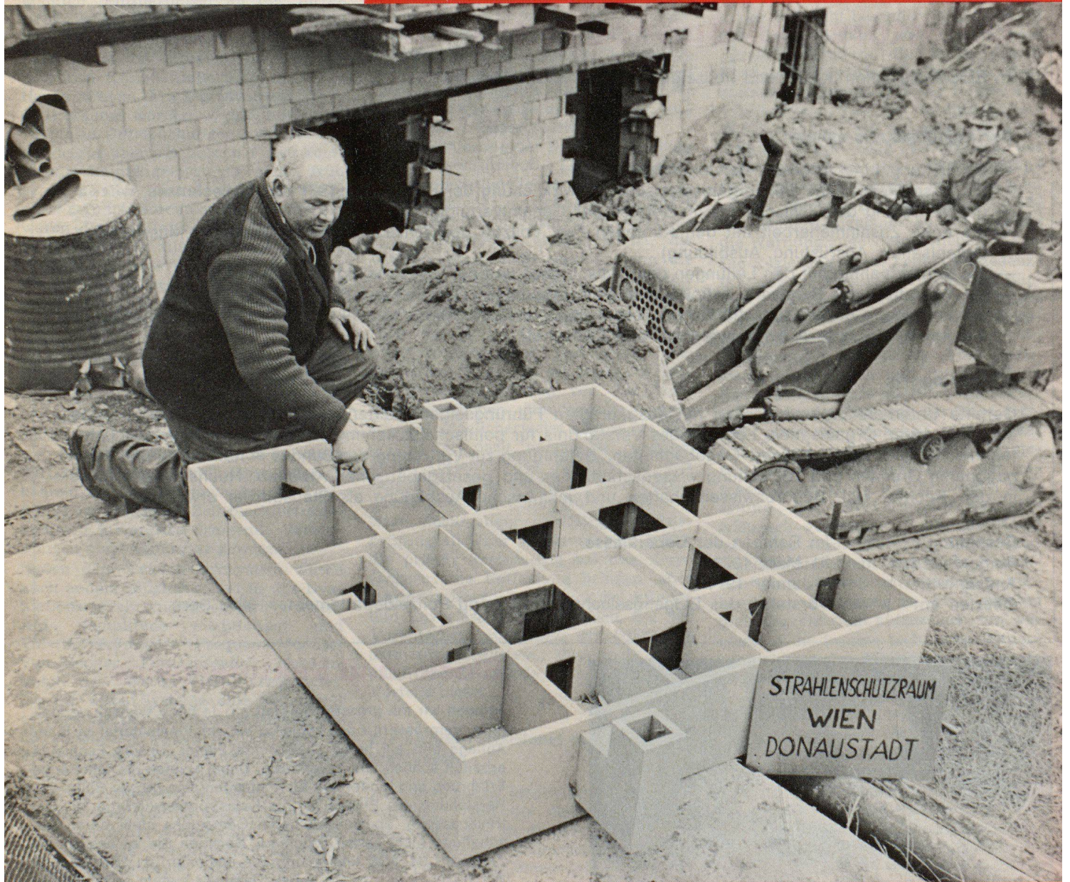
Modell des Gross-Schutzraumes, dessen Aushubarbeiten von Soldaten des österreichischen Bundesheeres übernommen wurden