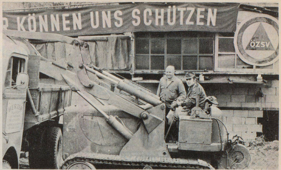
Das Bundesheer im Einsatz beim Schutzraumbau

Der Bildbericht wurde nach den Angaben und Fotos von Frau Gertrud Baumann, Wien, von der Redaktion zusammengestellt.