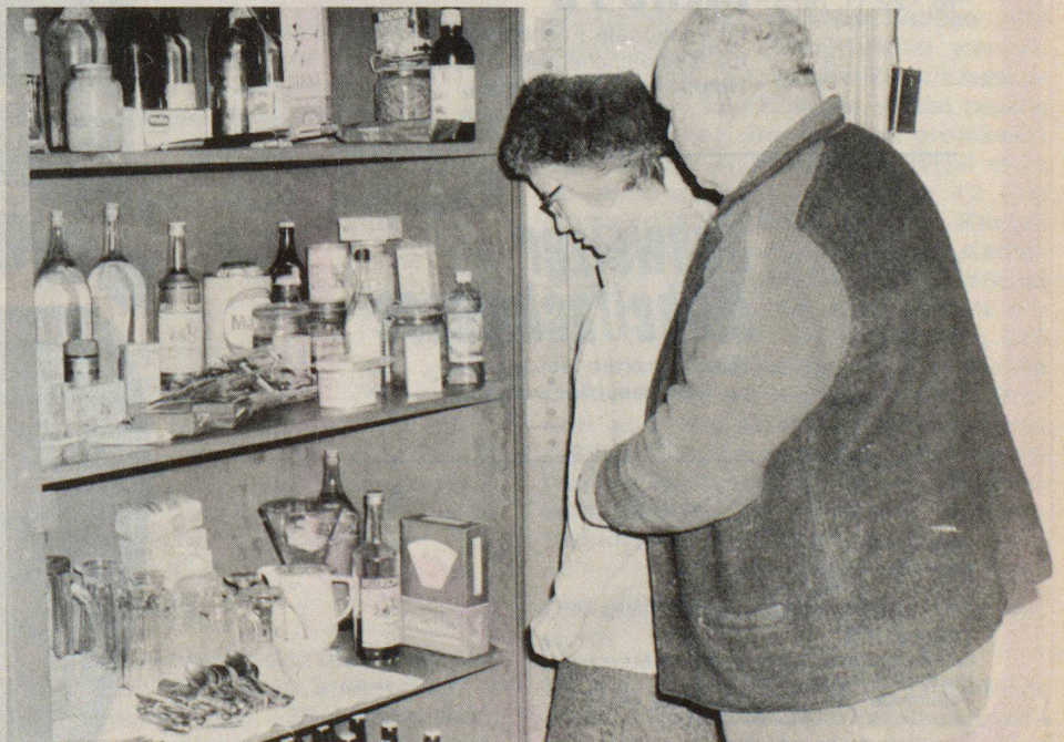
Auch an den Notvorrat wurde gedacht. Es wurden auch Testversuche mit Lebensmitteln gemacht