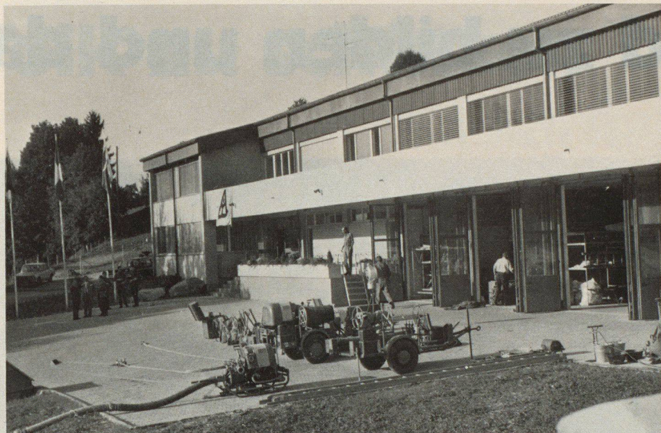
Abb. 2. Das Theoriegebäude mit den Magazinen

getragen. Es darf auch beigefügt werden, dass die Schweizer PTT die einzige Postbehörde der Welt ist, die für ihren im Zivilschutzgesetz verankerten Betriebsschutz eine zentrale Ausbildungsstätte besitzt und wie die SBB im Rahmen der Bestrebungen der Gesamtverteidigung ihren Anteil leistet.