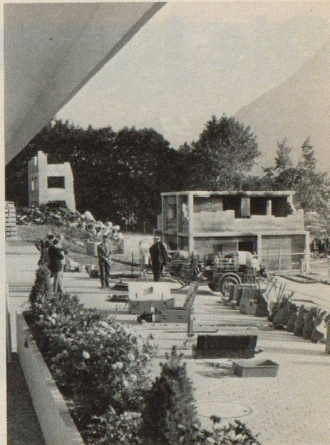
Abb. 3. Blick über einen Teil der rationell angelegten Übungspiste. Im Hintergrund grüssen die Berner Alpen

leider ist dies immer noch nicht überall der Fall – haben allen Schwierigkeiten zum Trotz einen guten Teil zur Realisierung der Wünsche des Ortschefs bei-