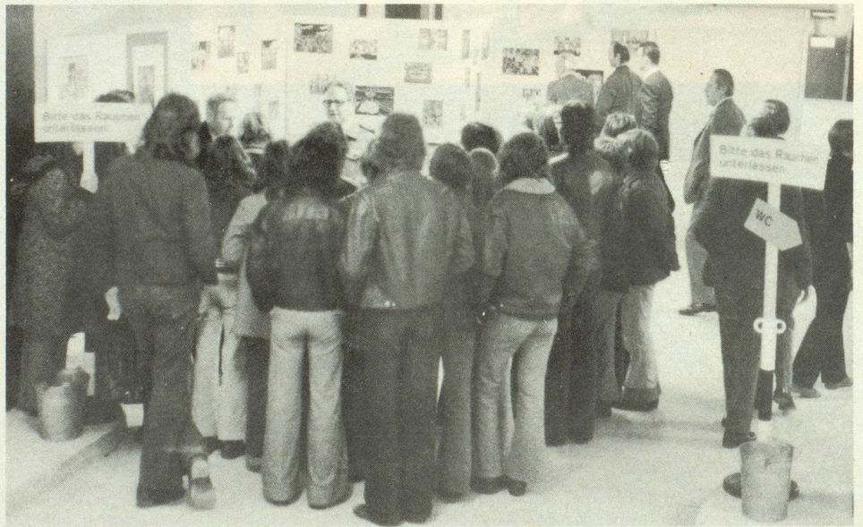
Es war erfreulich, dass auch die Jugend den Tag der offenen Tür in Winterthur benützte, um sich über den Zivilschutz als Glied unserer Gesamtverteidigung orientieren zu lassen.

Wir werden in der kommenden Mainnummer unserer Zeitschrift, deren Schwerpunkt auf das Leben im Schutzraum ausgerichtet ist, eingehend über das Beispiel Winterthur berichten und uns auch mit der Organisation für das Leben im Schutzraum befassen.