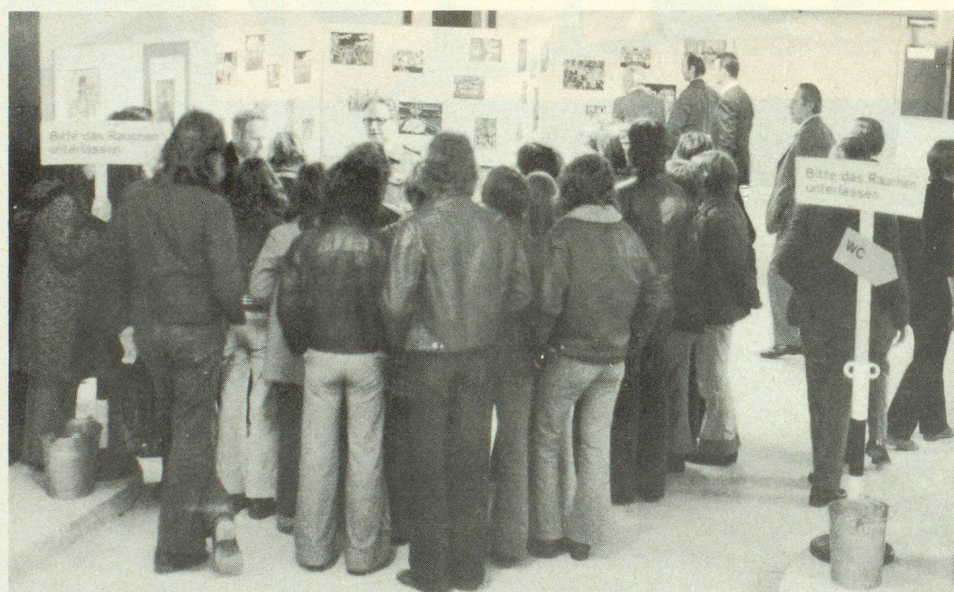
Es war erfreulich, dass auch die Jugend den Tag der offenen Tür in Winterthur benützte, um sich über den Zivilschutz als Glied unserer Gesamtverteidigung orientieren zu lassen.

Wir werden in der kommenden Mainnummer unserer Zeitschrift, deren Schwerpunkt auf das Leben im Schutzraum ausgerichtet ist, eingehend über das Beispiel Winterthur berichten und uns auch mit der Organisation für das Leben im Schutzraum befassen.