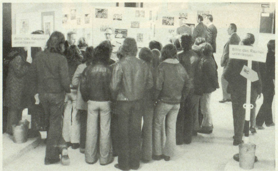
Es war erfreulich, dass auch die Jugend den Tag der offenen Tür in Winterthur benützte, um sich über den Zivilschutz als Glied unserer Gesamtverteidigung orientieren zu lassen.

Wir werden in der kommenden Mainnummer unserer Zeitschrift, deren Schwerpunkt auf das Leben im Schutzraum ausgerichtet ist, eingehend über das Beispiel Winterthur berichten und uns auch mit der Organisation für das Leben im Schutzraum befassen.