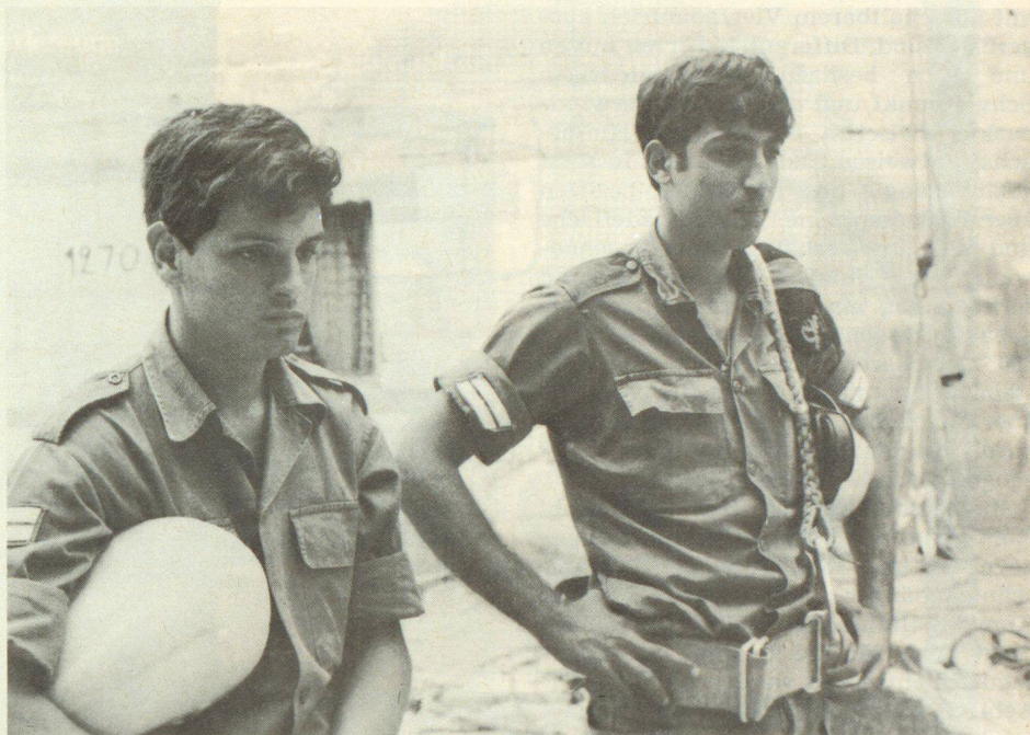
Die Soldaten des israelischen Zivilschutzes, der HAGA, empfangen uns gerne zu einem weiteren Studienbesuch

Abstecher nach Eilat am Roten Meer erweitert wird, ist erschienen. Kosten: Alles inbegriffen 2143.— Fr. Für diese Reise haben sich schon viele Interessenten gemeldet. Weitere Interessenten werden gebeten, sich umgehend beim Zentralsekretariat des SBZ, Schwarztorstrasse 56, 3007 Bern , schriftlich zu melden, damit sie in die Teilnehmerliste aufgenommen werden können. Das Programm wird allen Interessenten mit einem Meldeformular zur definitiven Anmeldung zugestellt.