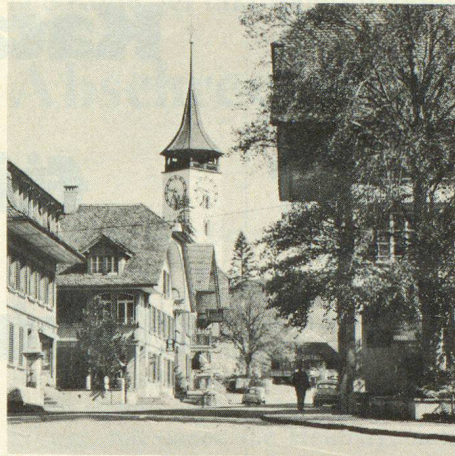
Steffisburg, ein altes währschaftes Berner Dorf, das bevölkerungsmässig eine Kleinstadt geworden ist

Das Tagungsprogramm umfasst eingehende Orientierungen über den Zivil-