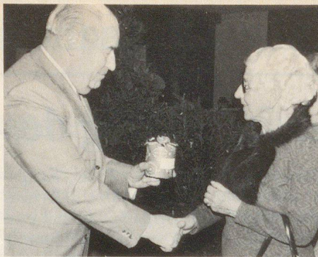
Der Thuner Gemeinderat und Nationalrat Urs Kunz verdankte mit Handschlag den Einsatz der aus dem Zivilschutz entlassenen Frauen und Männer, während ihnen der Ortschef von Thun, Ernst Walther, eine Kerze überreichte, damit das Licht ihres Dienstes für die Mitmenschen weiterbrenne

Männer verbunden, denen ein kleines Erinnerungsgeschenk überreicht wird. Diese Feier wurde am 4. Dezember 1975 in der Kaserne Thun zum drittenmal durchgeführt und soll in dieser Form beibehalten werden, wobei jeweils auch die Gemeindepräsidenten und die Ortschefs sowie weitere Persönlichkeiten des Amtes Thun eingeladen werden. Es ist erfreulich, dass man sich nun auch in andern Landesgegenden darauf besinnt, um die Entlassungsfeiern aus der Wehrpflicht im Sinne des Übertritts in den Zivilschutz zu gestalten. Zur Verfechtung dieser Idee wartet auch den Sektionen des SBZ und der Chefämter für Zivilschutz der Kantone eine dankbare Aufgabe.