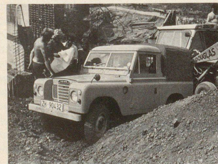
Véhicule de service pour travaux de chantiers

Lutte contre les incendies, contre la pollution par hydrocarbures, déblayage de la neige, génie civil, transport de malades, opérations de secours sur les lieux d'accidents ou de catastrophes, transport d'hommes ou de matériel, véhicule de dépannage ou véhicule-atelier – un véhicule tout-terrain est appelé à rendre les services les plus variés. Dès 1948, les usines Rover se sont spécialisées et ont tout mis en oeuvre pour adapter leurs modèles Land Rover aux impératifs les plus divers. Grâce à leur système d'éléments assemblables, un grand nombre de modèles de base variés et variables à souhait peuvent être livrés par l'usine. Depuis 1970, ce programme a encore été complété par la Range Rover à 2 ou 3 essieux. Cette polyvalence témoigne bien du fait que Rover est la seule marque à disposer d'un programme de véhicules de série à traction intégrale pouvant convenir à toutes sortes d'usages. Il va de soi qu'il existe d'innombrables possibilités d'affectations que le département des véhicules utilitaires de la British Leyland Switzerland vous présentera bien volontiers.