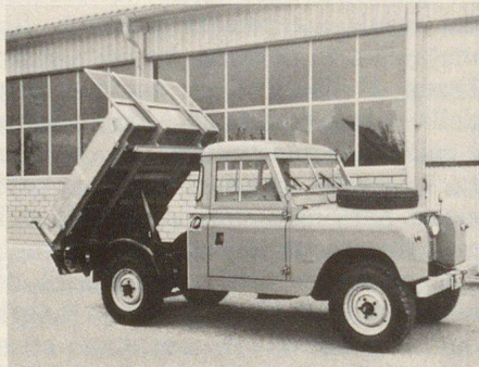
Génie civil: Land Rover 88 avec pont basculant