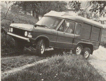
Opérations en cas de catastrophe, par ex. CFF