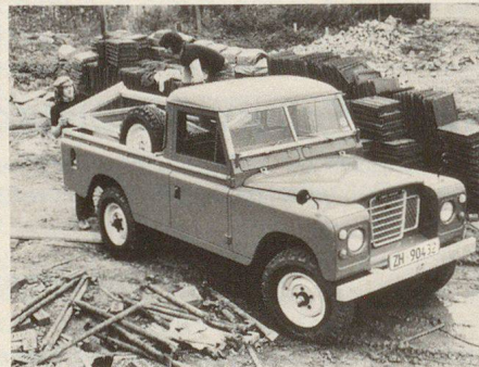
Transport de matériel