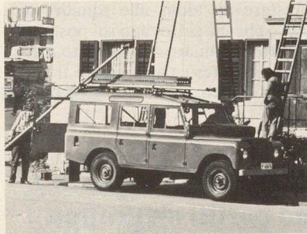
Pose de lignes téléphoniques ou câbles aériens