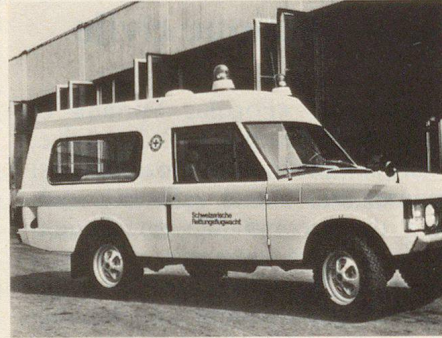
Ambulances (Garde Aér. Suisse de Sauvetege)