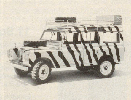
Land Rover 109 pour expéditions