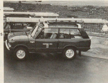
Véhicule d'intervention rapide

Lutte contre les incendies, contre la pollution par hydrocarbures, déblayage de la neige, génie civil, transport de malades, opérations de secours sur les lieux d'accidents ou de catastrophes, transport d'hommes ou de matériel, véhicule de dépannage ou véhicule-atelier – un véhicule tout-terrain est appelé à rendre les services les plus variés. Dès 1948, les usines Rover se sont spécialisées et ont tout mis en oeuvre pour adapter leurs modèles Land Rover aux impératifs les plus divers. Grâce à leur système d'éléments assemblables, un grand nombre de modèles de base variés et variables à souhait peuvent être livrés par l'usine. Depuis 1970, ce programme a encore été complété par la Range Rover à 2 ou 3 essieux. Cette polyvalence témoigne bien du fait que Rover est la seule marque à disposer d'un programme de véhicules de série à traction intégrale pouvant convenir à toutes sortes d'usages. Il va de soi qu'il existe d'innombrables possibilités d'affectations que le département des véhicules utilitaires de la British Leyland Switzerland vous présentera bien volontiers.