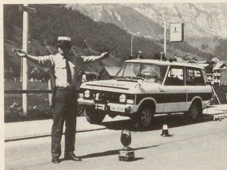
Véhicule pour les patrouilles de police