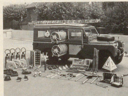
Lutte contre les incendies et contre la pollution