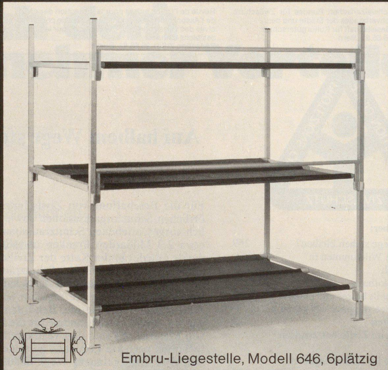
Embru-Liegestelle, Modell 646, 6plätzig

Embru ist Generalunternehmer für die Lieferung von über 20000 Liegestellen, samt Einrichtung der notwendigen Zusatzräume, wie Block-Leitungen, Quartier-Leitungen, Toilettenanlagen usw.