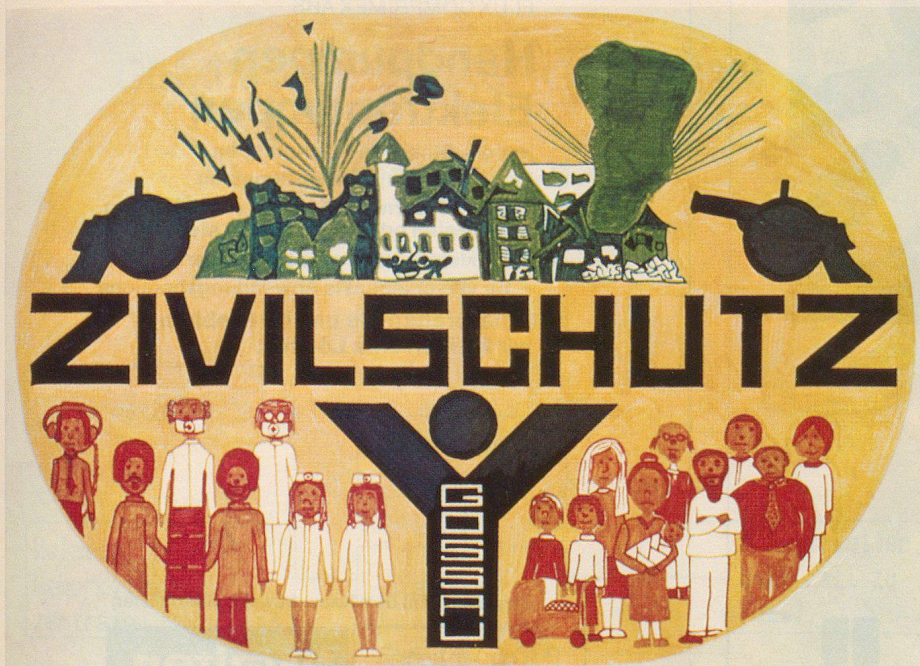
Katastrophenorganisation einer Gemeinde (mögliche Lösung)