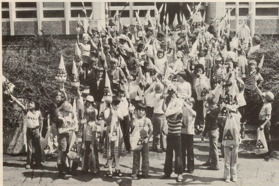
Die frohe Schar junger «Zivilschutzkünstler» vor dem Theoriegebäude des regionalen Zivilschutzzentrums in Riedbach. Eins, zwei, drei...

gen den Münsterturm, erhielten ein «Znüni» auf der Münsterterrasse, machten einen Rundgang durch das Bundeshaus, besichtigten das Rathaus und den Bärengraben und wurden dann im Zivilschutz-Ausbildungszentrum der Stadt Bern, in Riedbach, zum Mittagessen eingeladen. Am Nachmittag wurde wahlweise der Tierpark Dählhölzli oder das Marzilibad besucht und dann voller Eindrücke aus der Bundesstadt gegen Abend wieder in Freiburg, St. Ursen, St. Silvester und Marly einzutreffen. Ein gelber Zivilschutzschirm und weitere kleine Geschenke werden die jungen «Zivilschutzkünstler» noch lange an ihren als Auszeichnung gedachten Besuch in Bern erinnern.