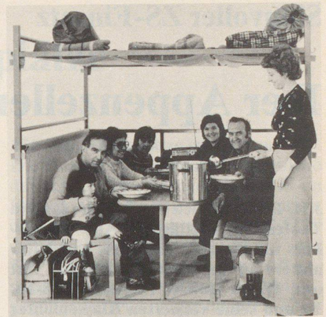
Im Rahmen der Zivilschutzkonzeption 1971 warten vor allem den Frauen wichtige Aufgaben, wie zum Beispiel im Schutzraumdienst, wo es um die gute Betreuung der Insassen geht.

Geboten aber wäre es, die Möglichkeiten freiwilliger Mitarbeit der Frau vermehrt auf das abzustimmen, was ihr je nach Vorhandensein und Art der Familienpflichten zu leisten eben möglich ist. Es versteht sich, dass zum Beispiel junge und kinderlose Frauen am ersten in der Lage sein werden, ausserhalb ihres Wohnortes Dienst zu tun, auch wenn er einen vollen Einsatz während Tagen oder Wochen erfordert. Gerade unter den nicht erwerbstätigen Hausfrauen und Müttern dagegen könnten und möchten wohl nicht wenige eine einschlägige Aufgabe übernehmen, wenn sich ihnen unter der Woche einmal oder mehrmals zu bestimmten Stunden Gelegenheit dazu böte. Zu denken wäre hier an Einsätze im Verpflegungsdienst des Zivilschutzes oder im Sani-