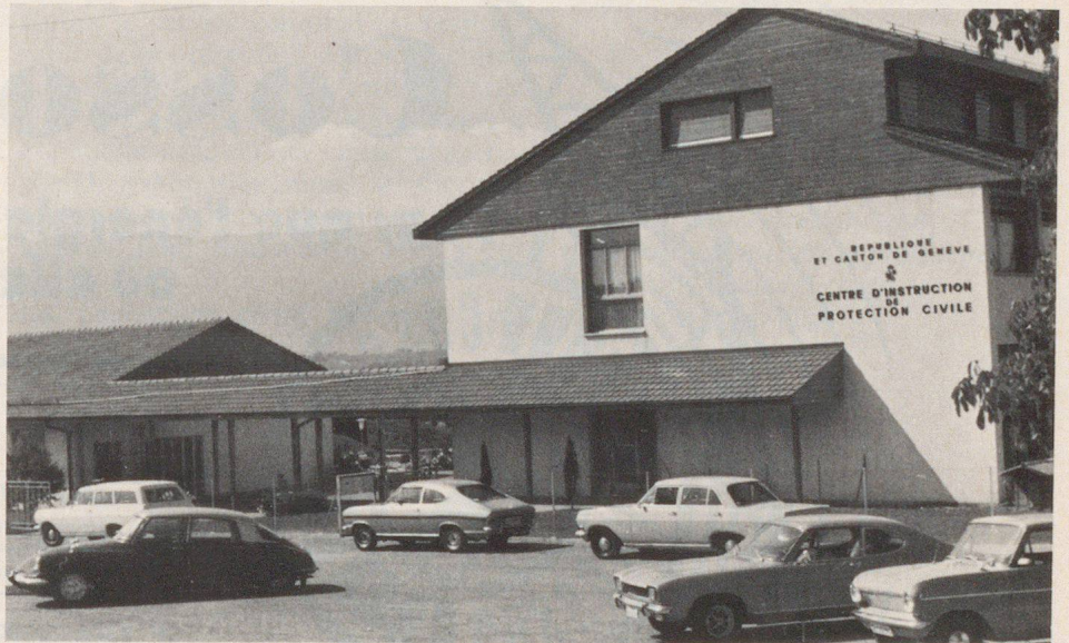
Le premier centre de formation de la protection civile a été créé à Bernex, en tant que prototype.

Bien que son organisation ne soit pas terminée, la protection civile genevoise est opérationnelle depuis 10 ans,