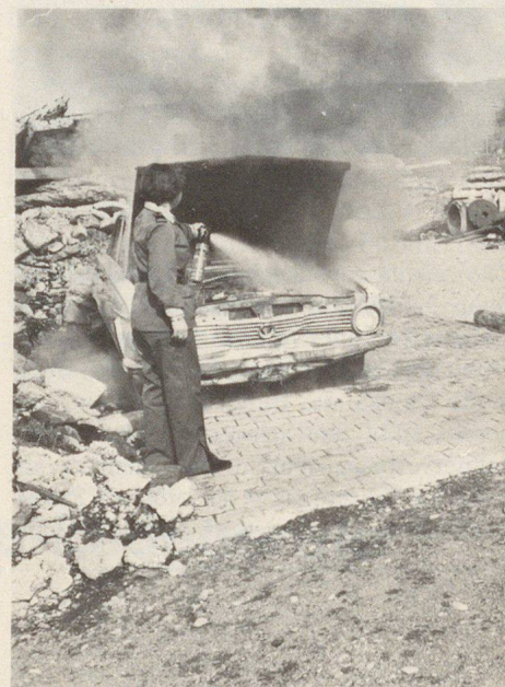
Entstehungsbrände wie Kurzschlüsse, Vergaser-, Polsterbrände usw. sind mit dem Handfeuerlöcher zu bekämpfen. Feuerlöcher, die in der untersten Ecke des Kofferraumes gelagert sind, verlieren ihre Daseinsberechtigung. Sie müssen in Griffnähe montiert sein.