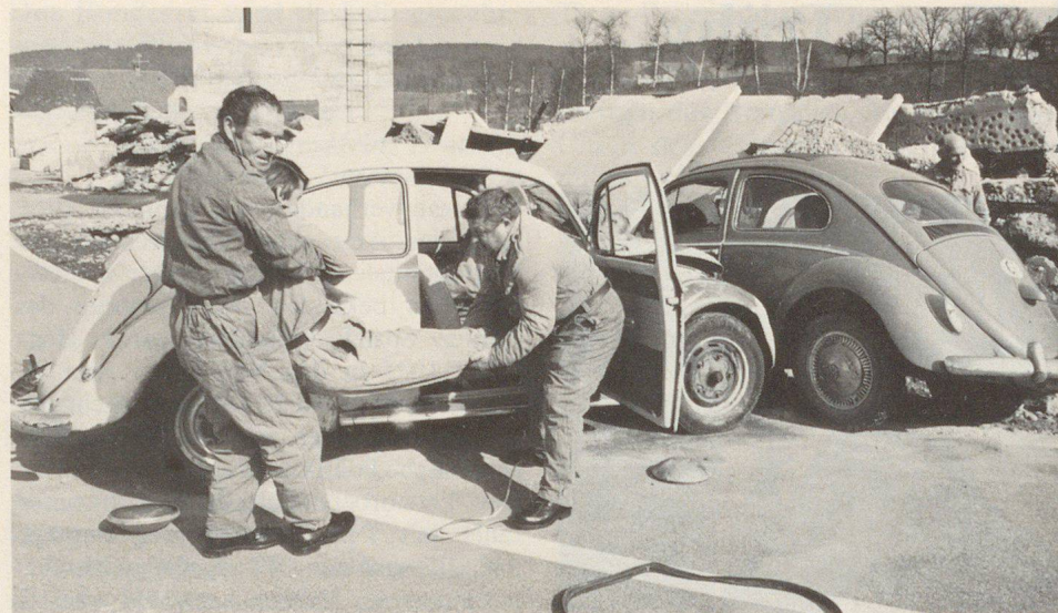
Frontalkollision: Hier wird der Ernstfall geübt. (Überblick verschaffen, Gefahren erkennen, Unfallstelle absichern, Selbstschutz, Bergen, Lebensrettende Sofortmassnahmen, Alarmierung von Polizei und Sanität, Überwachung der Verletzten, Auskunft an Polizei und Sanität.)

Realistische Übung auf dem Zivilschutzausbildungszentrum Schötz als Schwergewichtsbildung in den diesjährigen Wiederholungskursen. Jahr für Jahr verunfallen allein bei Strassenverkehrsunfällen in der Schweiz zwischen 30 000 und 40 000 Menschen. Eine Situation, die scheinbar unabwendbar ist und die wir beinahe als eine Gegebenheit unseres heutigen Lebens betrachten. Eine traurige Bilanz auch, die noch negativer wird, weil aufgrund von ärztlichen Untersuchungsergebnissen feststeht, dass viele der fast 2000 Verkehrstoten gerettet werden könnten, wenn im Moment der Lebensbedrohung einfache, zur Lebensrettung notwendige Handgriffe von den Anwesenden angewandt würden. Zuerst der Mensch – dann erst die Frage nach der Schadhafung und der eventuellen Strafbarkeit. Nicht der Ruf nach der Polizei, sondern die Sorge um den Verunfallten ist nach einem Verkehrsunfall dringend.