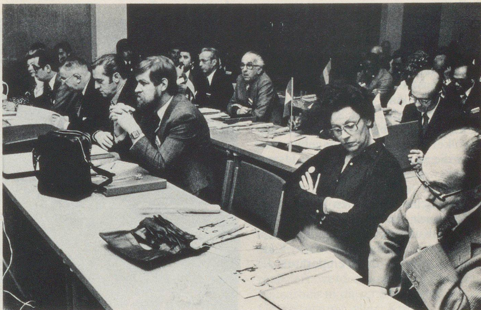
Die Schweizer Delegation an der ZS-Konferenz in Helsinki.

Im Rahmen der Informationstagung vermittelte der Generaldirektor des Zivilschutzes in Gabun ein Exposé