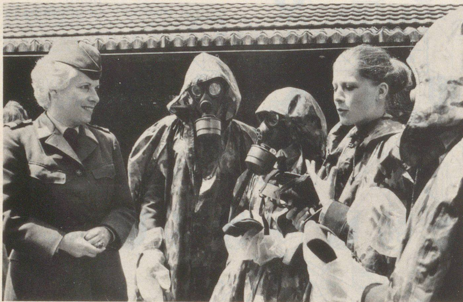
Auch der AC-Schutz gehört zur Ausbildung unserer FHD.