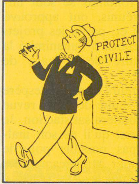
— Protection civile ou PA, sans intérêt pour MOI!