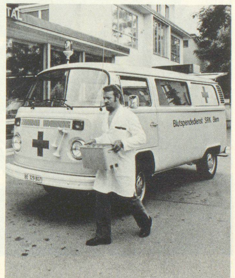
Blutspendedienst Service de transfusion de sang