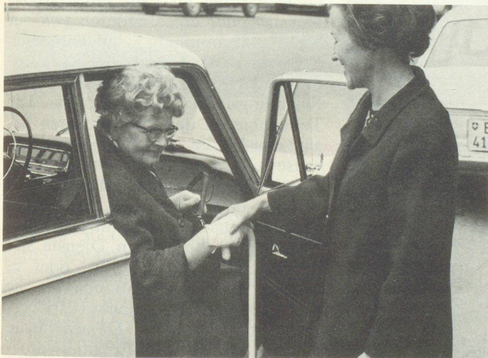
Autodienst des SRK: Rotkreuz- Autofahrerin Service automobile de la CRS: conductrice Croix-Rouge