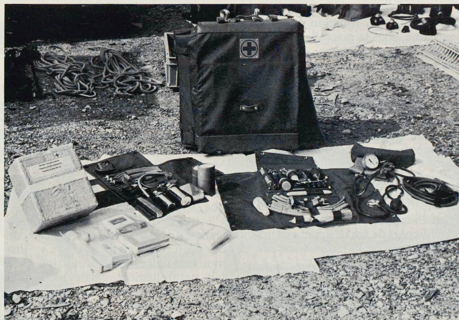
La remorque sanitaire catastrophe permet de soigner jusqu'à 200 blessés

Les conditions atmosphériques ne furent pas très favorables puisqu'il fallut subir un jour et demi de pluie. Si la fermeté alliée au tact était le mot d'ordre pour ces trois journées, garder sourire et calme dans ces conditions fut parfois difficile. Néanmoins, on peut affirmer que tout baigna dans l'huile et que cadres et instructeurs de protection civile savent aussi faire preuve de psychologie, même dans l'humidité et l'adversité.