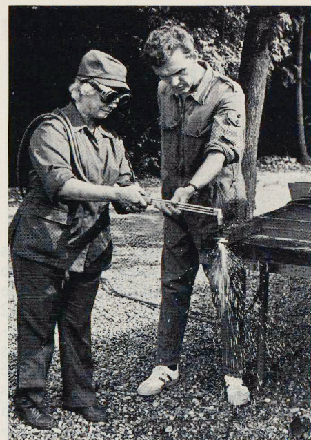
Même les dames s'initient aux travaux de sauvetage dits «masculins»