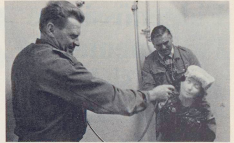
«Kühle Köpfe kühlen». Verbrannte Körperteile gehören sofort unter das kalte Wasser!

Insbesondere bei den Verbrennungen scheint es mir sehr wichtig zu sein, dass die Kaltwasserbehandlung verbrannter Körperteile zum Allgemeingut werden sollte. Die Verletzungen der Zivilbevölkerung im Vietnamkrieg (über 40% Anteil der Verbrennungen) zeigen drastisch die Wichtigkeit der Ausbildung auf diesem Gebiet im Zivilschutz. Weiter lernen die Teilnehmer, wie Medikamente aufbewahrt werden sollten, was die Marken auf den Packungen bedeuten, wie eine Hausapotheke zusammengestellt wird, wie Vergiftungsfälle zu behandeln (beim geringsten Zweifel natürlich zum Arzt) sind – kurz, alles Dinge, welche jederzeit von grossem Nutzen sein können.