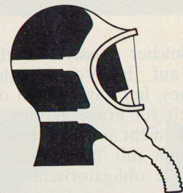
Staub- und Gasmasken Schutzhauben

Generalvertretung - Beratung - Verkauf - Service