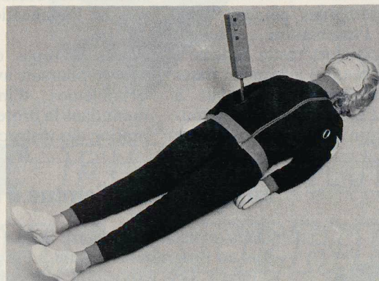
Übungspuppe Resusci-Anne «NEU»