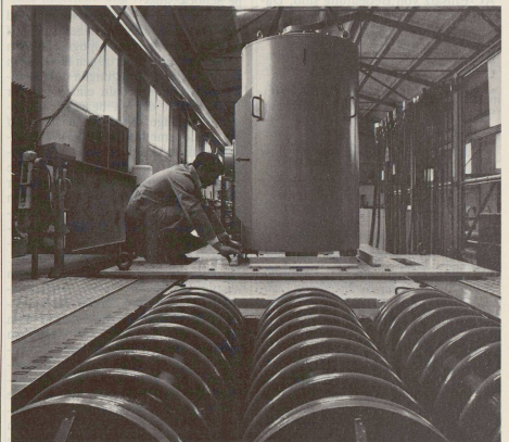
3-t-Schockprüfungsmaschine / Table de choc (3t) / Macchina per le prove d'urto 3to.