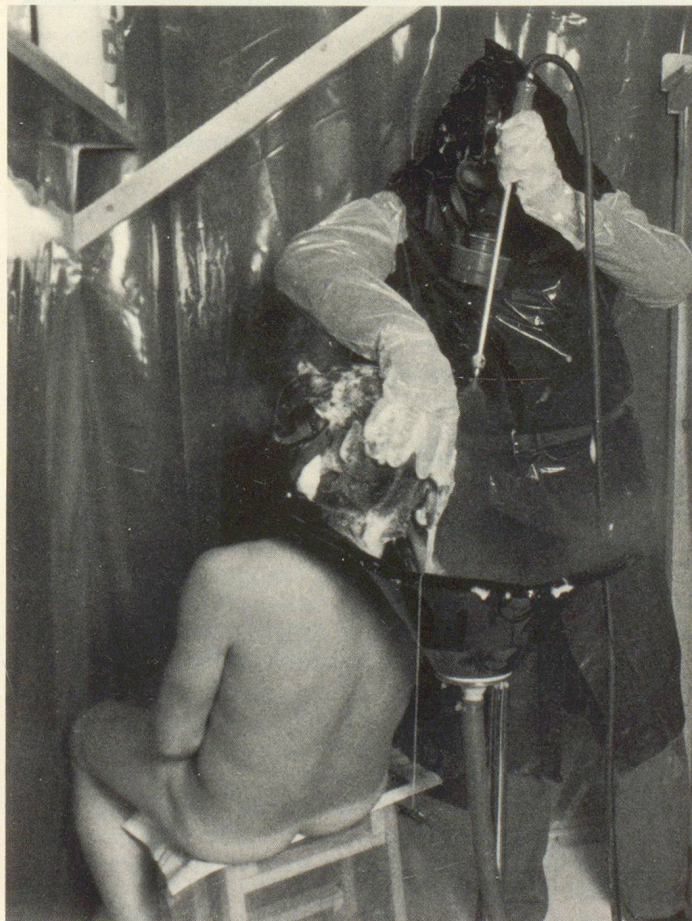
Schnappschuss von der praktischen Demonstration einer behelfsmässigen Dekontaminationsstelle.