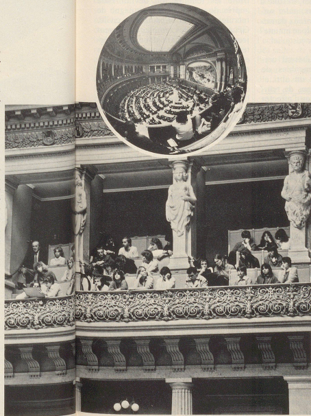
Zivilschutz 7/8 82

Des visiteurs intéressés assistent depuis la tribune aux débats sur la protection civile dans la salle du Conseil national.