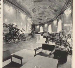
Impressionen aus dem Nationalratssaal während der Sommersession 1982.