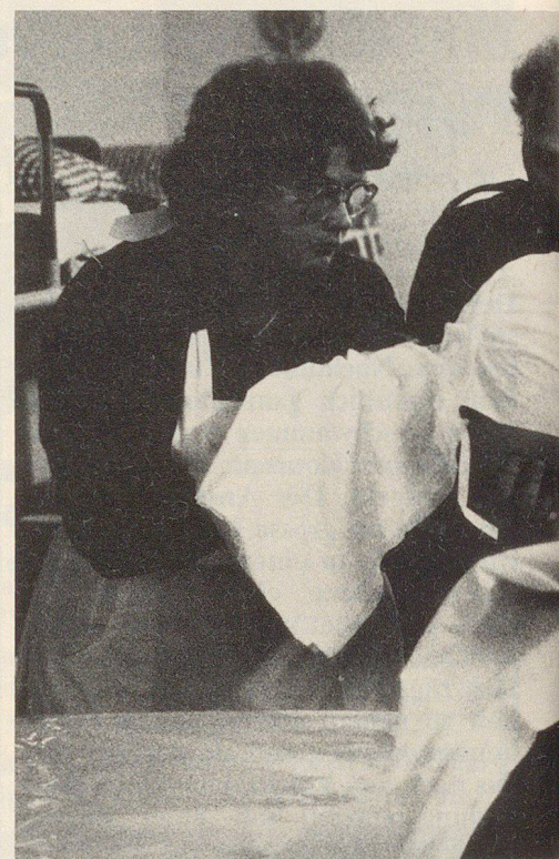
Es braucht viele Hände, um einen Schwere

Übungsschluss erfolgte, musste die Übungszeit (auf dem Papier) um vier Stunden verlängert werden.