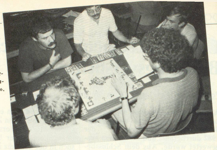
Monopoly-Spiel gehörte zu den Truppen-«Aufstellern».

Anstelle eines «Normaltagesablaufes» wurde ein Staffeltbetrieb mit zwei oder drei Einselementen diskutiert. Der Staffeltbetrieb hat vor allem den Nachteil, dass einzelne Einselemente eine Zeitverschiebung in Kauf zu nehmen haben und zudem gegenseitige Lärmstörungen auftreten. Wegen der beschränkten Platzverhältnisse hat jedoch der Kommandant für das Gros der Insassen einen Staffeltbetrieb mit drei Einselementen festgelegt. Dagegen wurden nur je zwei sich ablösende Kommando- und Küchengruppen gebildet. Die gewählte Organisation hat sich für die Nutzung des vorhandenen Platzes als günstig erwiesen und schaffte Raum selbst für sportliche Betätigung und militärische Ausbildung. Gegenseitige Störungen