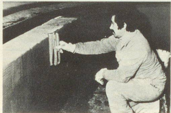
Egalisieren und verdichten der Oberfläche (Finish).

Im Grundwasserbereich wurden alle starren Abdichtungen mit Renesco-Vandex-Beschichtungen ausgeführt. Es handelte sich hauptsächlich um Arbeitsfugen der Bodenplatten, Unterfangungselemente und Ankerköpfe. Schwachstellen und Schwindrisse im Beton, die nach Vollendung des Rohbaus auf-