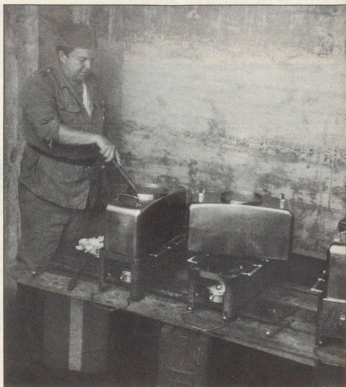
Kochen im Unterstand Cuire dans un abri de sécurité Cuocere in un rifugio

■ Senden an / A renvoyer à: Verkaufsbüro: Firestar AG/SA Postfach, CP 3363 CH-4002 Basel Tel. 061/30 35 75, Telex 63 631