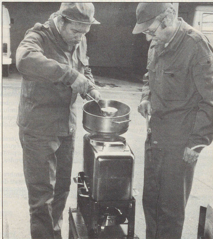
Aufgebaute und kochbereite Station: einfach, sauber, gefahrlos und effizient Station de cuisine prête à l'emploi: simple, propre, sûre et efficace Cucina da campo montata e pronta per l'impiego: semplice, pulita, sicura ed efficace