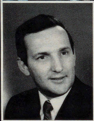
Ing. Engelbert Paul Planungsbüro Kurzbauer in Wien

„Bei grossen Bauvorhaben, wie es der Wohnpark Alt-Erlaa in Wien darstellt, konnten wir nur Produkte auswählen, mit denen man bereits gute Betriebs-erfahrungen gemacht hatte...“