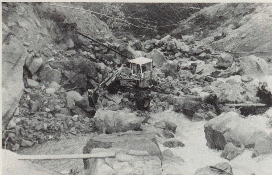
Ein Bagger räumt gesprengte Blöcke weg.

gemacht werden. Die dritte Gruppe sorgte mit ebensolchen Drahtschotterkörben dafür, dass beim Hirsiggraben die Böschungen nicht weiter einstürzen konnten. Ein Holzverbau an der vierten Arbeitsstelle diente demselben Zweck.