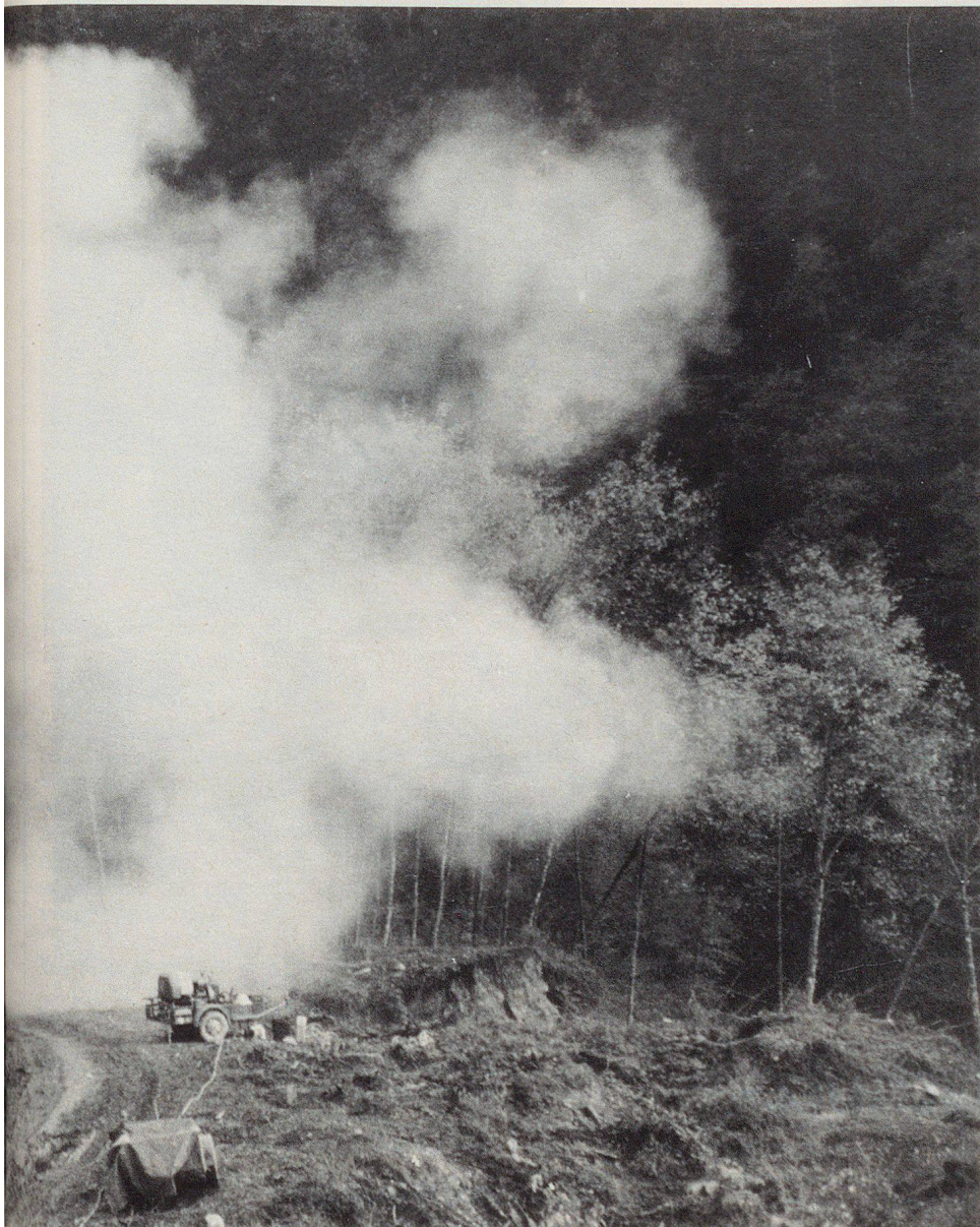
Soeben erfolgte eine Sprengung von wegversperrenden Felsbrocken.